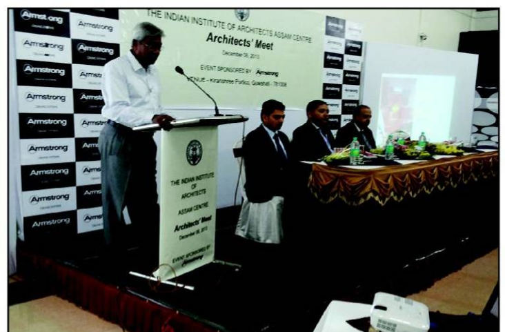
3rd Architect's Meet Assam Centre