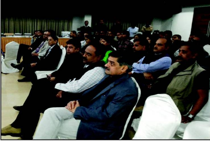
Gathering at 3rd Architect's Meet Assam Centre