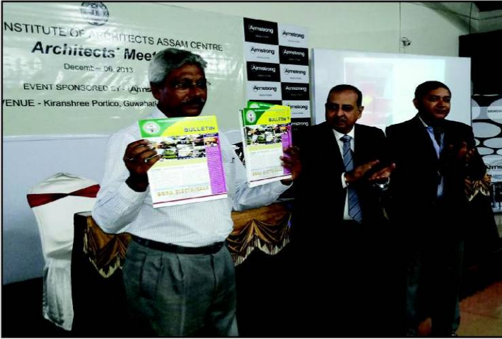
3rd edition of bulletin published by IIA Assam Centre