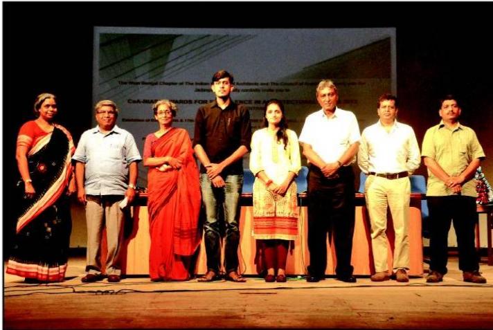
The WB Chapter Chairman with the Jury and others

West Bengal Chapter hosted the NIASA, CoA competition for excellence in architectural thesis, 2013 (central and east zones) through zonal exhibition and evaluation by Jury, at Jadavpur University. The event saw a gathering of the esteemed jury and faculty, and students from different colleges. Gandhi Bhawan at Jadavpur University was the venue for evaluation by jury while the Exhibition Hall in the Institute of Chemical Engineers' Building at Jadavpur University held the exhibition on 14th, 16th and 17th of August, 2013. The Department of Architecture of Jadavpur University was very helpful in securing the venue.