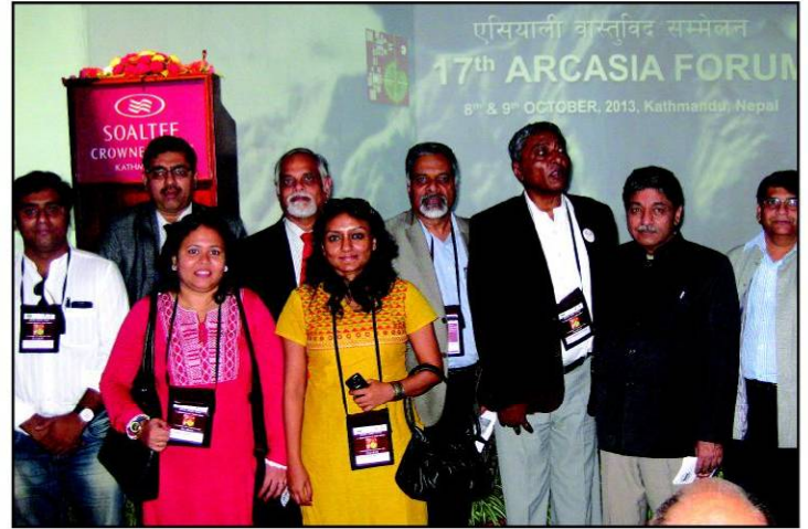
The delegates of IIA at ARCASIA